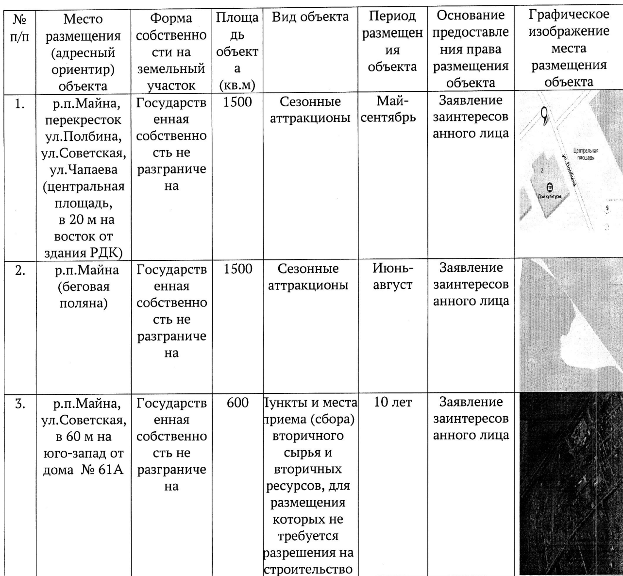
Схема размещения нестационарных объектов предоставления населению возмездных услуг